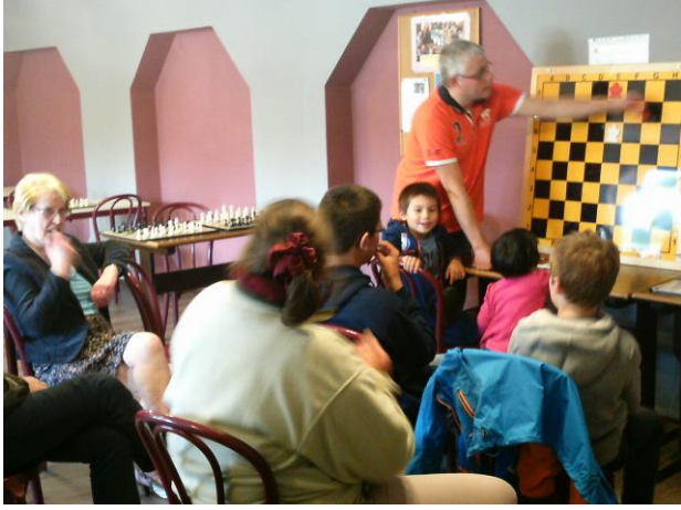
Une bonne ambiance avec beaucoup de participation de la part de chacun

Ne perdons toutefois pas de vue que le Conseil de participation du collège Ste Gertrude ne s'est intéressé que tardivement à notre projet ce qui peut éventuellement expliquer, dans une certaine mesure, le faible taux de participation à cette journée d'accueil. Toutefois, et pour autant que l'on puisse se référer aux commentaires formulés par le président du conseil de participation du CSGN, se seraient 1500 familles qui pourraient finalement être contactées par email avant le 2 octobre, date de début de la formation, et se voir proposer la participation à nos cours d'échecs !