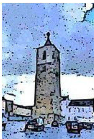
Logo du cercle du CELB Anderlues

Alors que nos troupes viennent d'essayer une amère défaite face à un adversaire à notre portée nous nous préparons, à l'occasion de notre premier déplacement de l'année, à rencontrer la jeune et talentueuse équipe d'Anderlues2, digne représentante du CELB / La Bourlette-Anderlues.