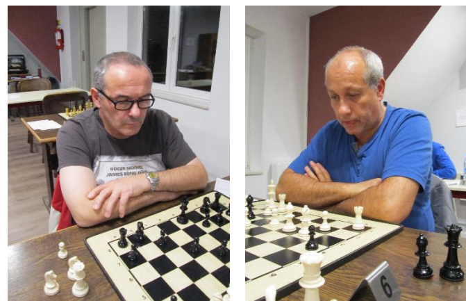
Face à face entre deux fidèles du PDR