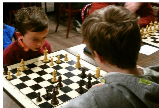
...qui n'en revient pas.

Tandis que les petits nouveaux se succèdent dans notre Cercle, représentant autant de garanties pour le futur, les anciens nous reviennent aussi et avec quel