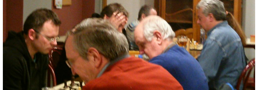
Alignement presque parfait !...

Cinq parties se jouaient ce vendredi dans le cadre des journées d'alignement de notre championnat.