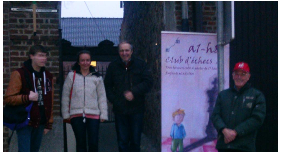
L'équipe sur le point d'en découdre...