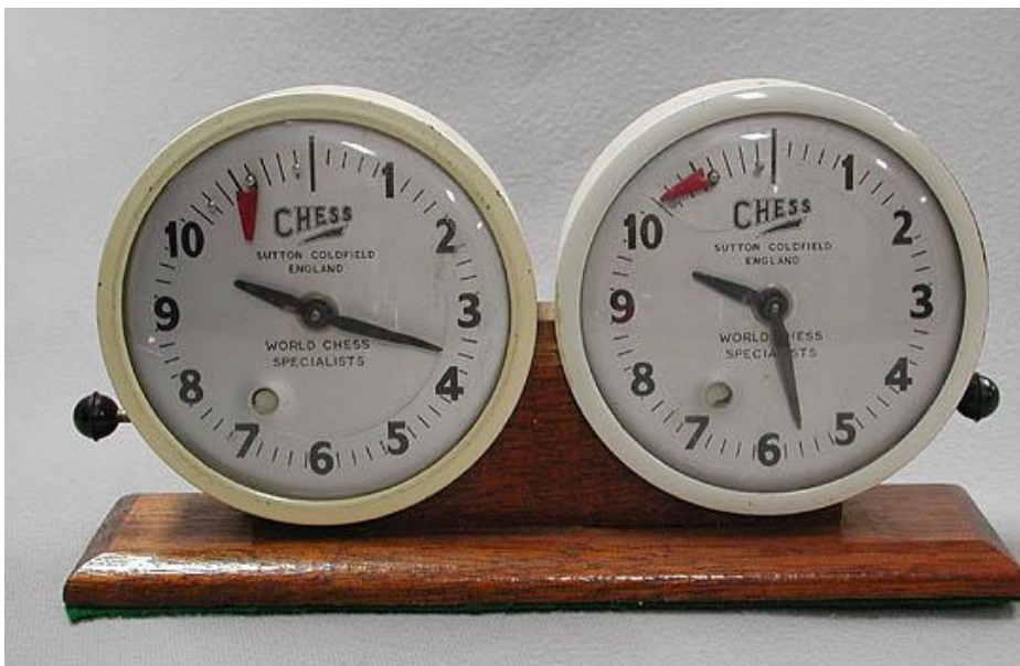
Pendule anglaise de marque Sutton-Coldfield des années 1950-1960

Présentation de pendules remarquables parce que c'est joli, qu'on aime ça, que c'est (in)utile, que certains en redemandent, qu'il y en a encore mais plus beaucoup...