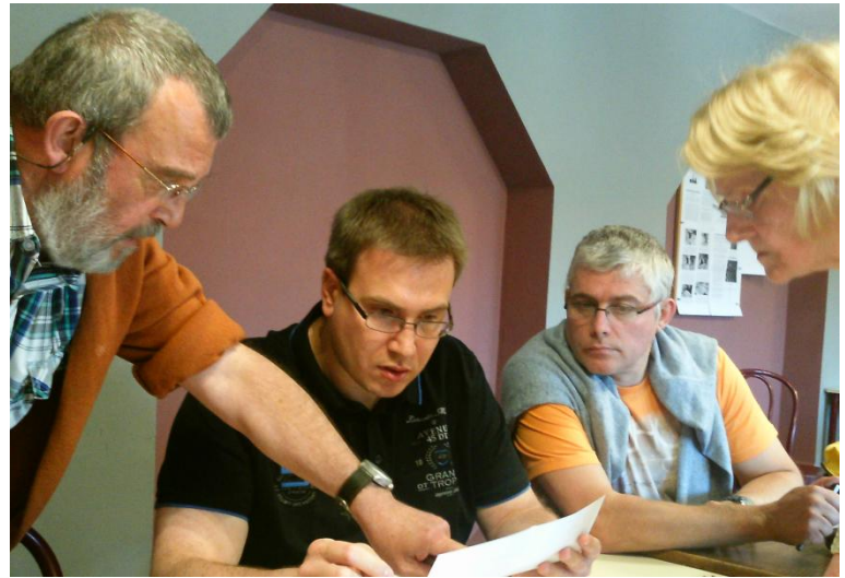
Le chantier informatique nécessite une bonne planification, les comitards planchent.

communication informatique dont notre cercle souhaite s'équiper afin de renforcer son attractivité auprès des joueurs de la région ainsi que son potentiel de recrutement auprès, notamment, des plus jeunes... Assurément un gros chantier ! Souhaitons-lui bonne chance dans ses nouvelles responsabilités.