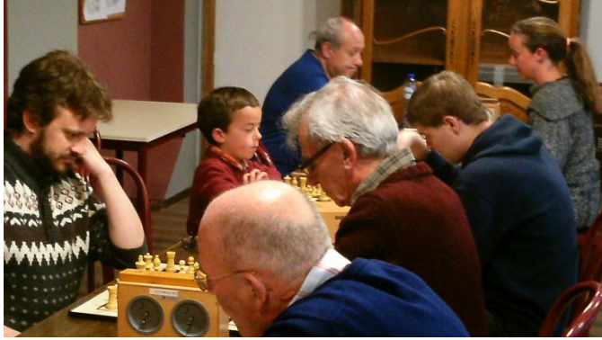
Autant de vainqueurs que de perdants sur cette photo